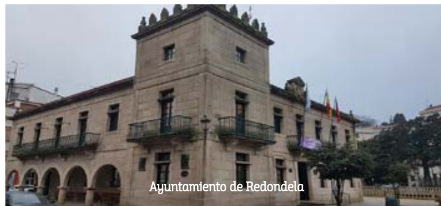
Ayuntamiento de Redondela