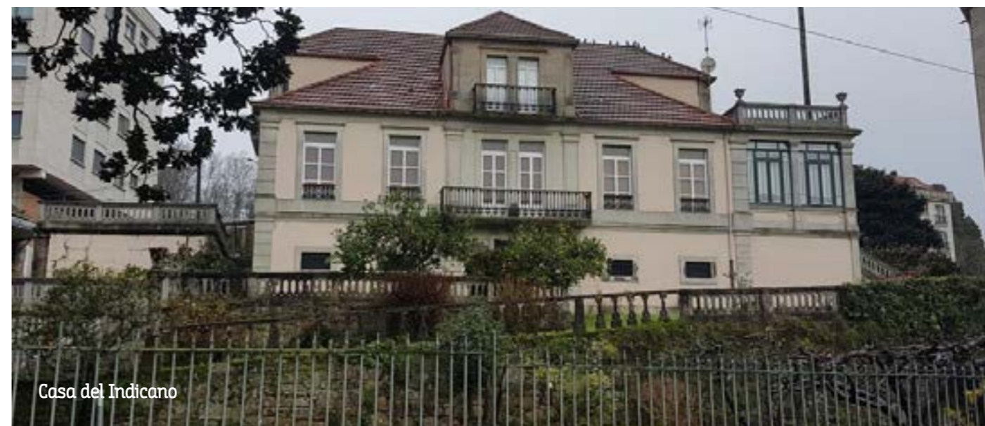
Casa del Indiano

literarias más destacadas son Luces de Bohemia , Divinas Palabras y Tirano Banderas .