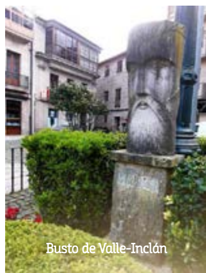
Busto de Valle-Inclán

Este escritor gallego (1866-1936) es el creador del esperpento , un género literario que usa descripciones distorsionadas de la realidad para criticar a la sociedad. Algunas de sus obras