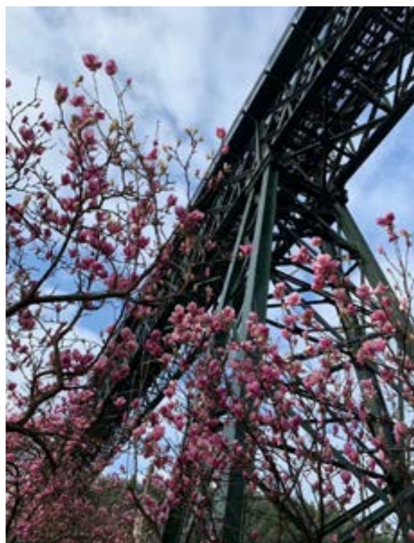
Viaduc de Pontevedra (Paula Cabrera Veiga)