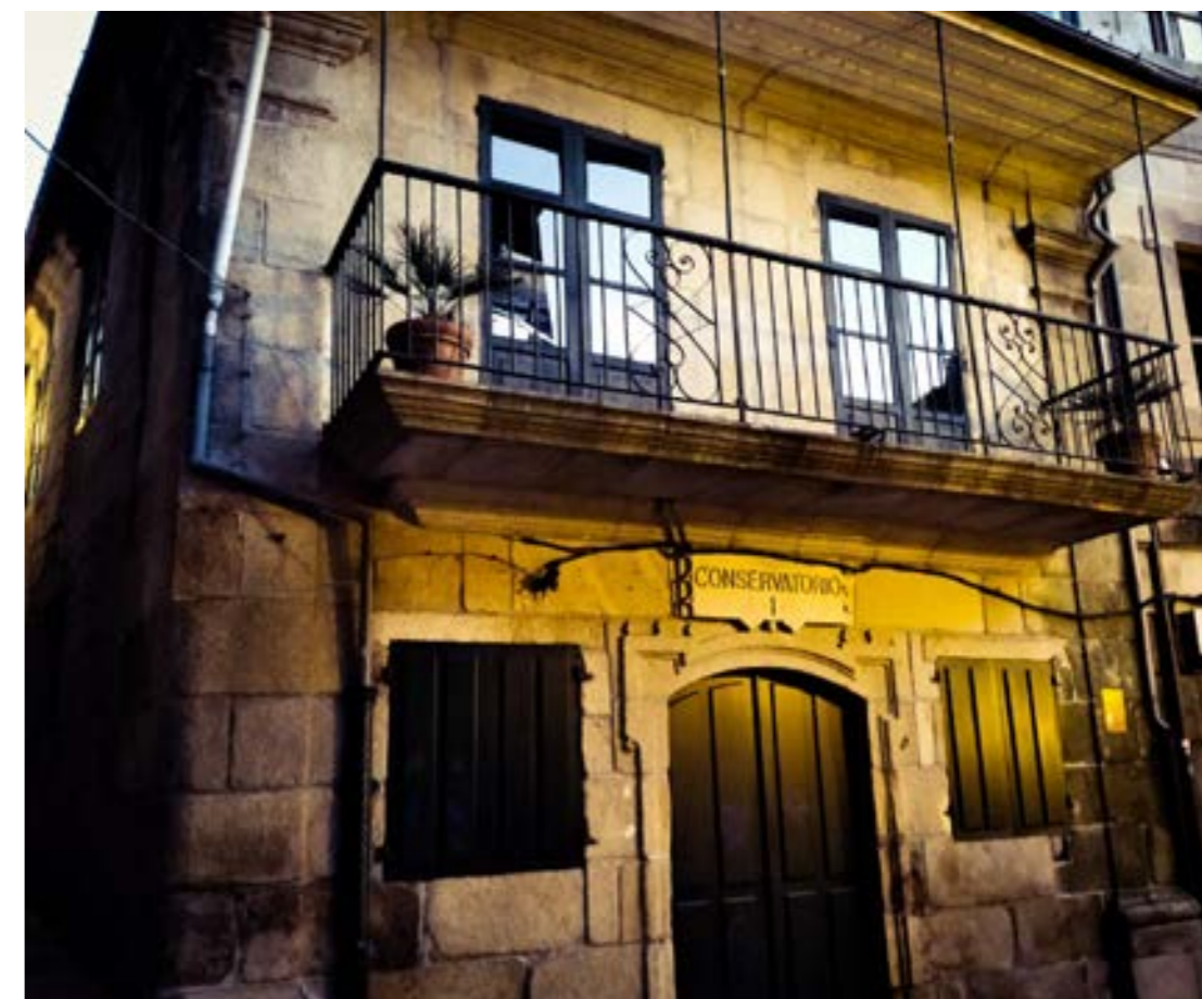
L'ancienne mairie (Pablo Gómez Muñños)

Tout au long de ses ruelles pavées et places animées on peut trouver des restes de son passé. Il y a des bâtiments médiévaux comme le Couvent de Vilavella (1), la Maison de la Tour (6) et l'église de Saint Jacques (9) à côté des restes de différentes époques de la ville comme l'ancienne mairie (10), l'ancienne prison (11) ou la Casa da Alfóndega (7). Il y a aussi des écus qui ornent les anciens "pazos" (5) comme souvenir de l'existence de familles nobles. L'activité agricole et de la pêche du passé est présente dans les maisons près de la Fontaine de Saint Jacques (18), dans les "cruceiros" et "hórreos" (8,12, 20). Les viaducs (2,19) ont ouvert le chemin